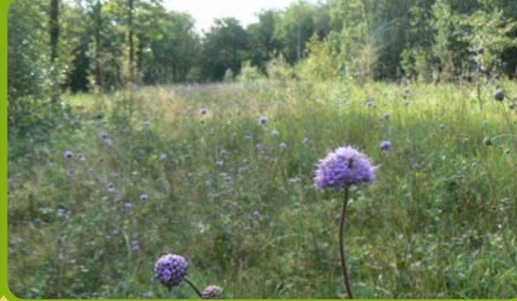
Layon forestier ouvert il y a 5 ans ayant vu réapparaître le Damier de la Succise