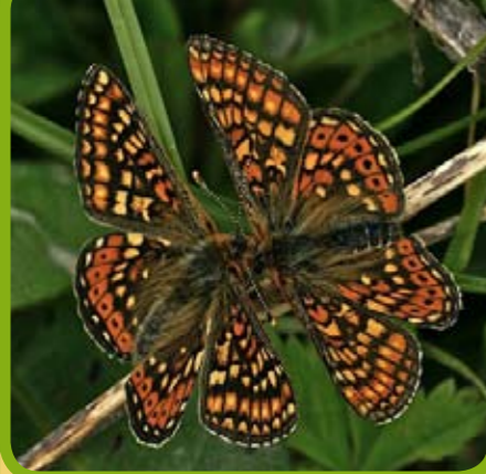
Le damier de la succise se reconnaît facilement aux quadrillages tricolore de la face supérieure de ses ailes