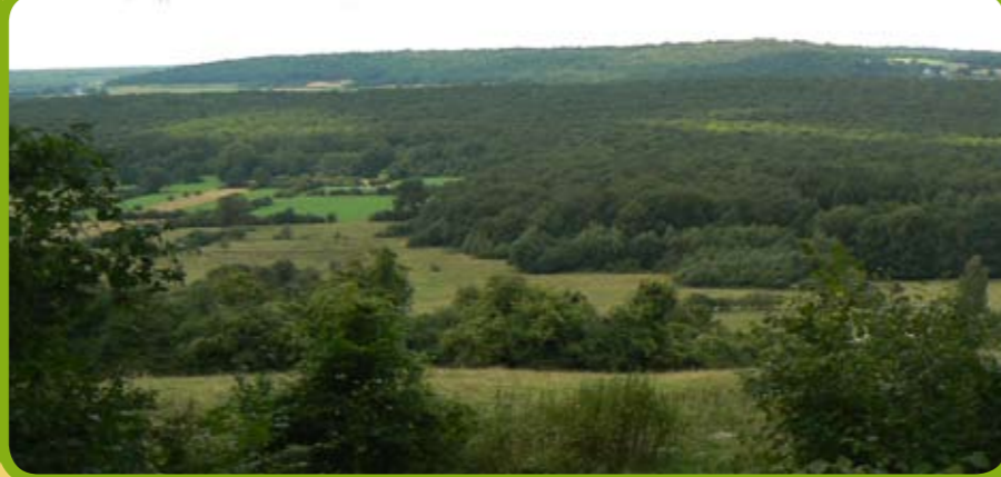
Vue sur la dépression schisteuse de Fagne, enclavée entre les reliefs du Condroz (dans le fond) et de la Cales-tienne (en avant plan)